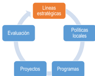
Fig. 1 Esquema de las líneas estratégicas dentro del ciclo de la Estrategia de Desarrollo Municipal del Cataurito de herramientas para el desarrollo local 2

No es casual entonces, la falta de un pensamiento complejo y estratégico en los municipios para la conformación de las políticas públicas que darán contenido a sus respectivas estrategias de desarrollo. La ambigüedad y simplificación de este esquema y de la fundamentación teórica que le acompaña deviene determinación causal, no la única, de las carencias y dificultades asociadas a los procesos de demanda de inteligencia sobre –y en- las políticas públicas que se gestan en el teatro político y administrativo de operaciones locales. La primera imprecisión se encuentra en la ausencia de definición de lo que asumen como política local.