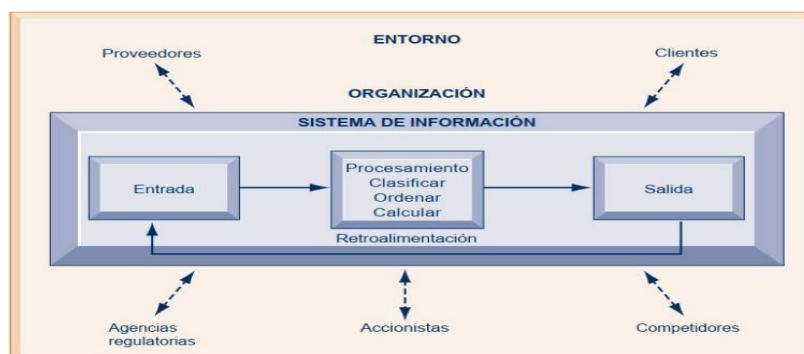
Funciones de un sistema de información