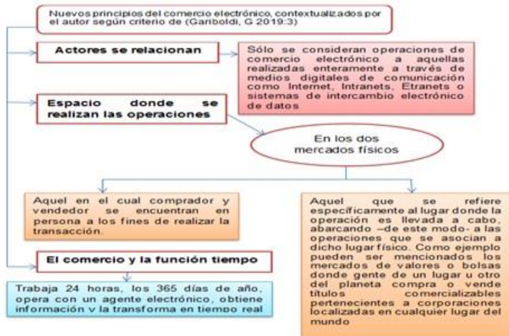
Figura 1: Nuevos principios del comercio electrónico

El comercio electrónico mantiene ciertas analogías y similitudes con el comercio tradicional, dentro de su contexto, los actores pasan a cumplir nuevos roles, operando en un nuevo ámbito y siguiendo los lineamientos de nuevos principios, es por ello que los futuros profesionales de nivel medio en la especialidad Contabilidad deben estar preparados para enfrentar este nuevo desafío en el contexto del mundo laboral. Dentro los nuevos principios del comercio electrónico se consideró pertinente asumir el criterio de (Gariboldi, 2019), ilustrados en el siguiente esquema.