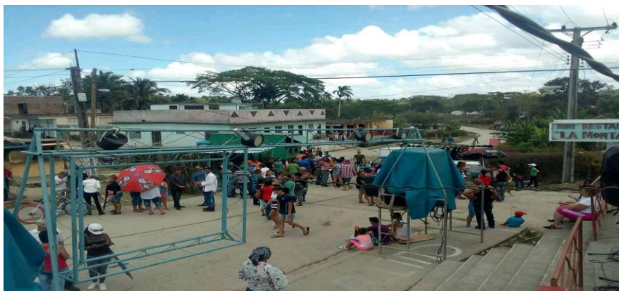
Fiesta popular desarrollada en El Pedrero

La actividad formativa, en general, se desarrolla desde las diferentes instituciones educativas, donde lo cultural es esencial para el joven, unido a su educación laboral (López Aballe et al., 2019).