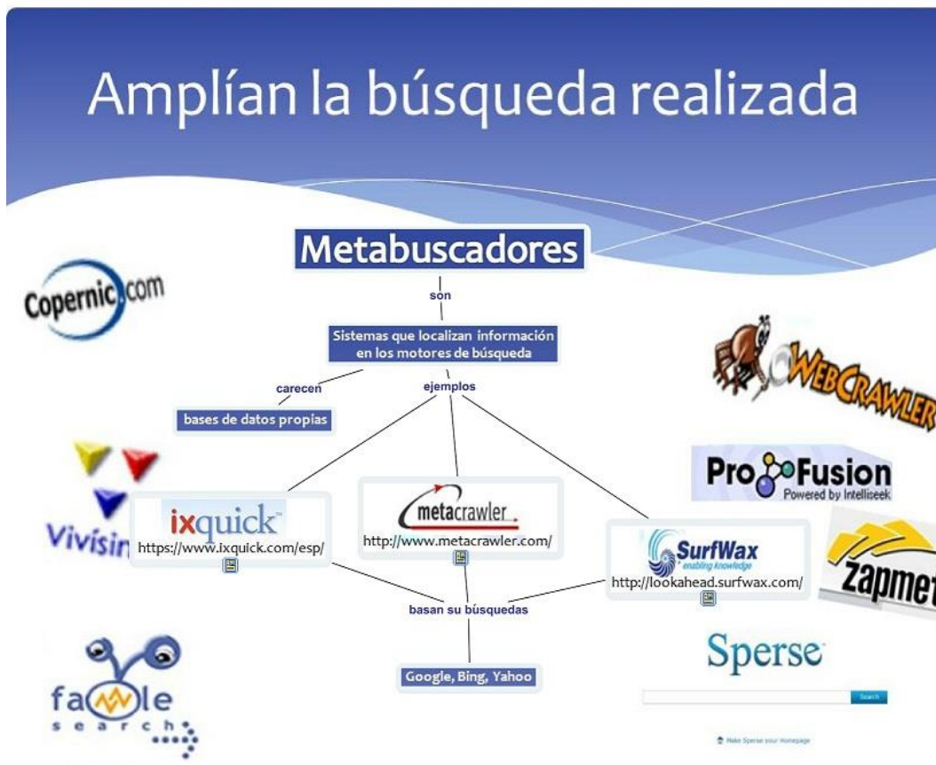
Figura 2. Mapa conceptual hipermedial sobre metabuscadores elaborado por los estudiantes